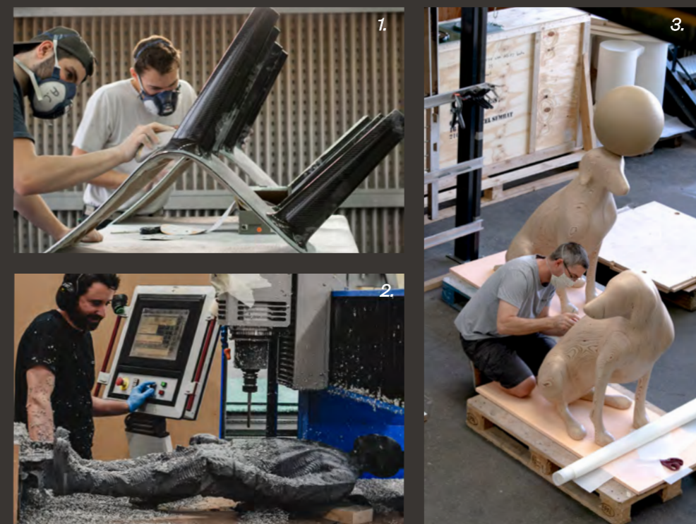
1. Finition d'une chaise en fibre de carbone / 2. Usinage de l'œuvre «The Neptunes» par Xavier Veilhan - Galerie Perrotin 3. «Okapi» par Xavier Veilhan - Galerie Perrotin

En intégrant un Bureau d'Étude et un laboratoire d'expérimentation , Cogitech s'assure d'une innovation constante, faisant de son approche hybride la clé de sa haute précision et de l'âme de ses réalisations d'exception.