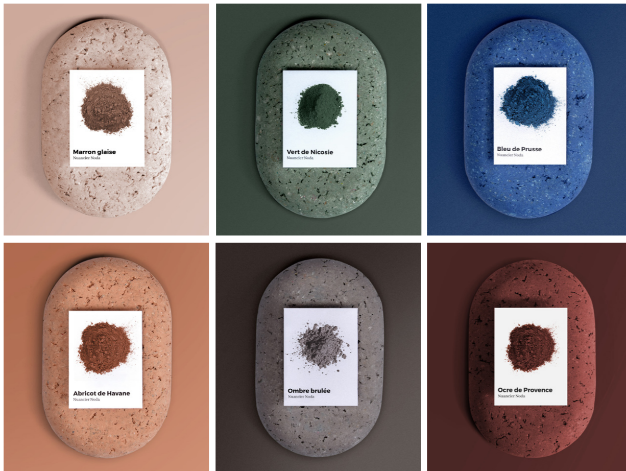
Nuancier pour la Collection de lampe «Noda» pour Manufacture XXI, par Studio Cogitech.

Collection «Noda» pour Manufacture XXI, par Studio Cogitech. Matière Papier, moulée, teintée dans la masse puis travaillée en surface par un vernis mat ou brillant.