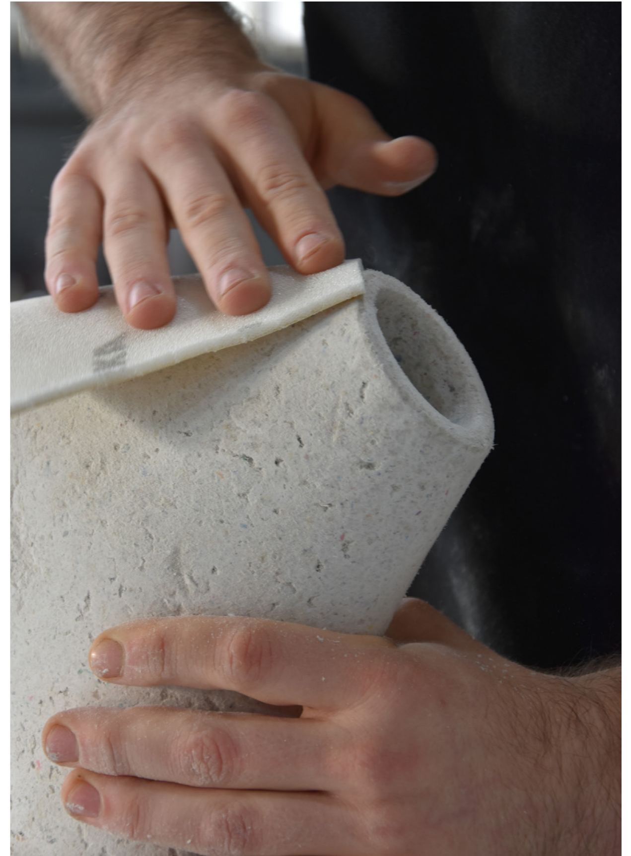
Fabrication des Lampes Noda, pour Manufacture XXI, en Matière Papier.